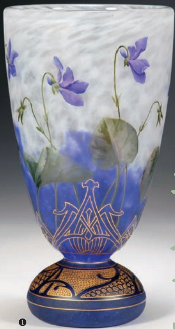
アールヌーヴオーのガラス