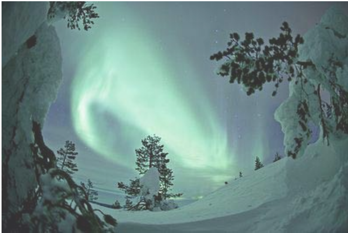
フィンランドのオーロラ