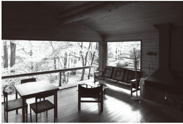
軽井沢の山荘(吉村山荘)森の中の家 内部

会期：2014年 5月31日(土)～7月6日(日) 会期中の休館日 6月3日(火)、10日(火)、16日(月)、17日(火)、24日(火)、7月1日(火)