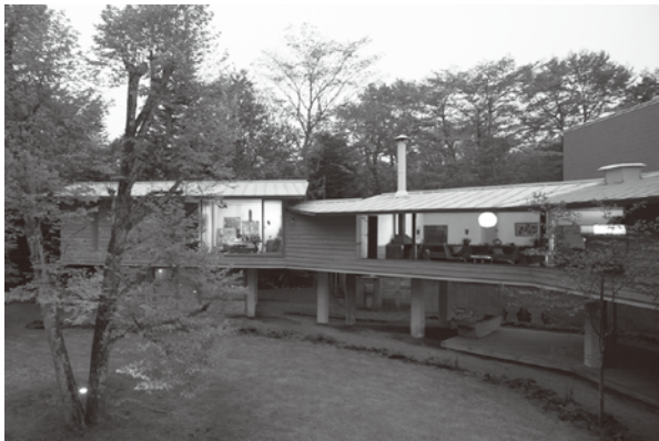
軽井沢の山荘(脇田邸) 外観

吉村順三(1908-1997)は、現代建築に日本の伝統と風土を融合させ、独自のモダニズム建築を迫及した建築家として知られています。