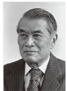
吉村順三