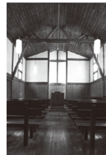
三里塚教会 内部