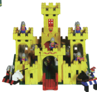
レゴブロック「お城」1978年