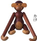
カイボイセンの猿 (デンマーク)