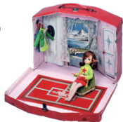
リカちゃんドリームハウス 1967年 (昭和42年) タカラトミー (当時タカラ) 日 本玩具文化財団蔵