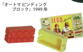
「LEGO Mursten(レゴブロック)」 1953年