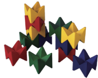
ネフスピール (スイス)