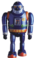
鉄人28号N.O.2 1960年 (昭和35年) / 野村トイ マテル / 奥飛騨おもちゃ博物館蔵 ©光プロダクション

遊びのシステムと10のルール ・遊びに無限の可能性・女の子にも、男の子にも ・どの年齢の子どもも夢中になる ・一年中遊べる ・健康的で静かに遊べる ・飽きがこない遊び ・想像力と創造力を伸ばす・使うほどに遊びの価値が増す ・常に現代的 ・安全で高品質